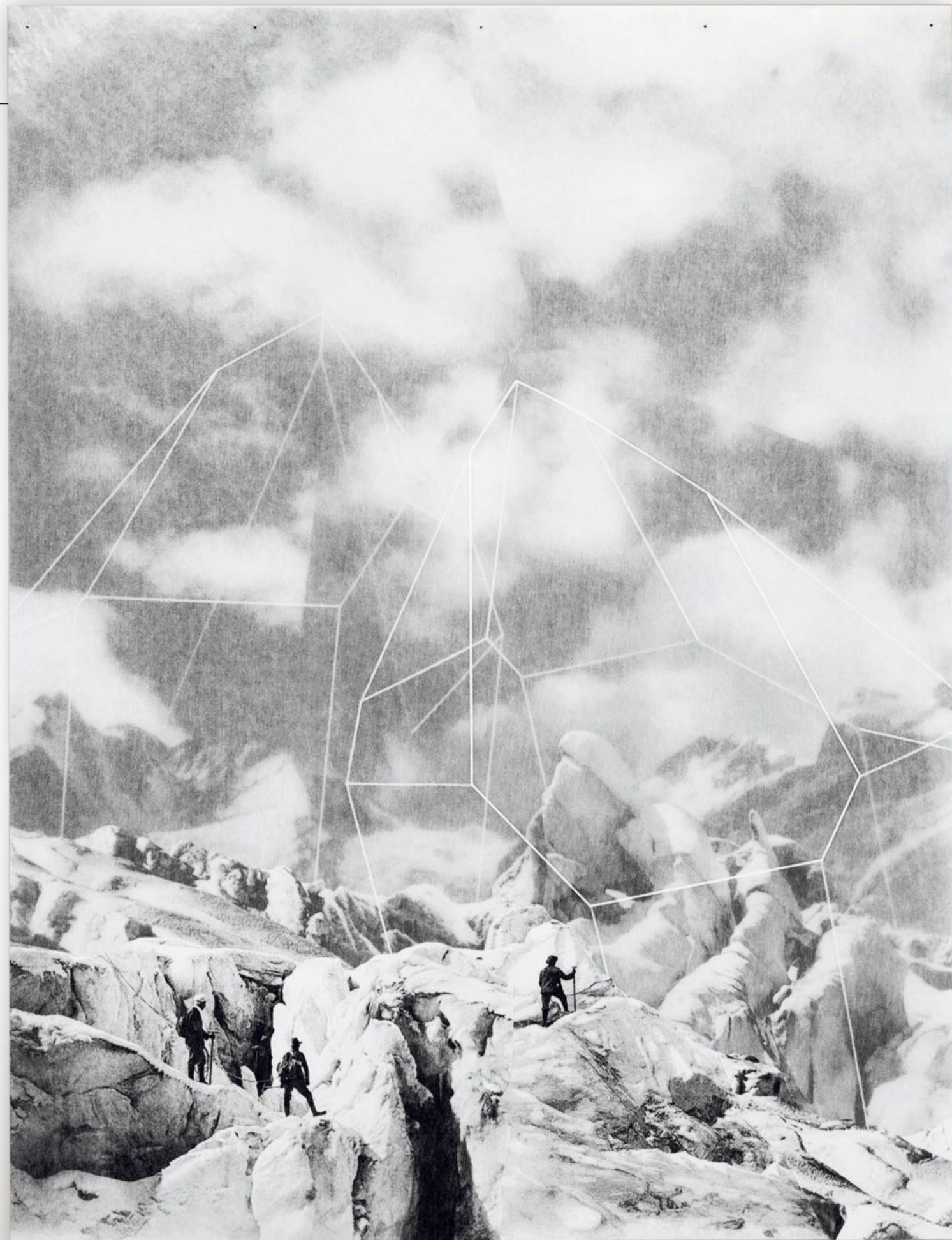
Ulrike Heydenreich, Neuland 04, 2013

Dat haar kunst te zien is in de tentoon-